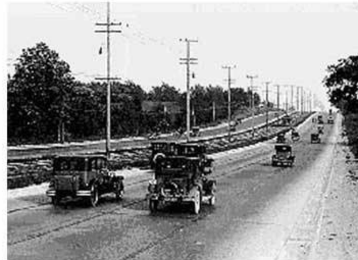
Woodward had a bit more open space and fewer cars in 1931.

La Avenida Woodward Avenue de Detroit, Michigan, fue la primera vía pavimentada del mundo.